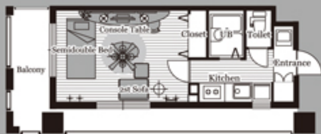
C-type (Living 8.9帖)