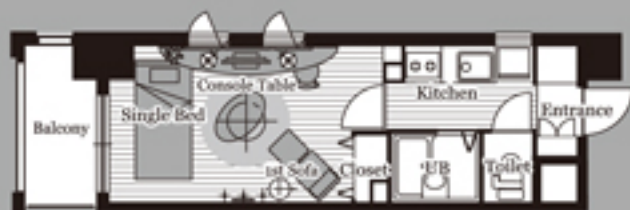
A-type (Living 7.8帖)

※下記掲載の間取り図は、パンフレットに写真が掲載されている部屋のもので、その他、備品やデザインが異なる部屋もございますので、詳細はお問い合わせください。