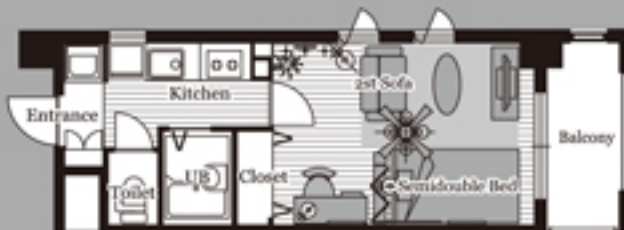
D-type (Living 9.1帖)