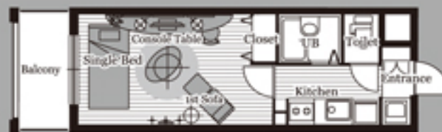
B-type (Living 7.7帖)